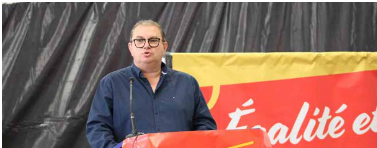
Conférence régionale CGT NA des 9 & 10 novembre 2022